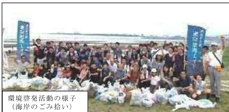
環境啓発活動の様子 (海岸のごみ拾い)