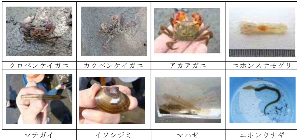
東京湾の干潟でみられた生物の例