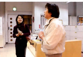
ふれあいプラザ：ここには車いすや音声誘導端末の 貸し出し、点字プリンター、授乳室などがある。 (けやきひろば1階 TEL: 600-3192)