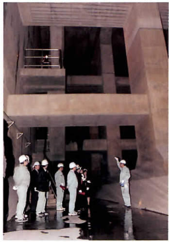
調整池：車や人の行き交う道路の地下深くにこんな空間が。想像以上に広く、臭いも気にならない。