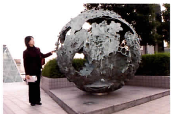
小学生が作成に参加したモニュメント： タイトルは「ほしにすむ」。参加した小学生の名前が 内側に刻まれている。