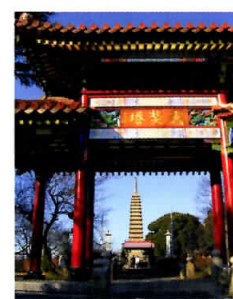
右:朱色のハツ橋が色鮮やかに映える『 岩槻城址公園 』。池には色鮮やかなスイレンも。「岩槻城址公園」バス停すぐ。 左:坂東三十三観音霊場の札所としても名高い慈恩寺は「慈恩寺観音」バス停の目の前。そこから15分ほど歩くと、三蔵法師の遺骨が眠る『 玄奘塔 』がそびえ立つ。