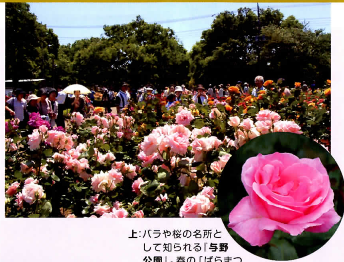
上:バラや桜の名所として知られる『 与野公園 』。春の「ばらまつり」では多くの人で賑わう。国際興業バス「与野公園入口」バス停徒歩3分。 左:妙行寺金毘羅堂には国天然記念物『 与野の大カヤ 』が凛とそびえ立つ。国際興業バス・西武バス「鈴谷大かや前」バス停徒歩2分。