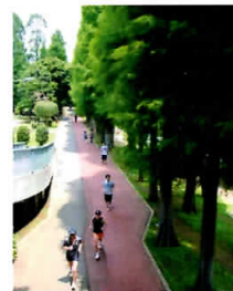
上:詩人の立原道造など数々の文化人が愛した『 別所沼公園 』。ジョギングで汗を流す方の姿も多い。「中浦和駅」バス停徒歩5分。 下:日枝神社の『 大久保の大ケヤキ 』は高さ20mで県内最大のケヤキ。「埼玉大学」バス停徒歩7分。