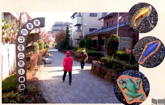
上:『 天王川コミュニティ緑道 』では、散歩を楽しむ方も多く、まちなかのちょっとしたオアシス。道すがらには、かわいいカエルや魚のオブジェも。東武バス「元町」バス停徒歩3分。 下:浦和西高校裏手の見沼代用水西縁沿いには、かつての姿をそのままに斜面林が続く。東武バス「西高前」バス停徒歩3分。