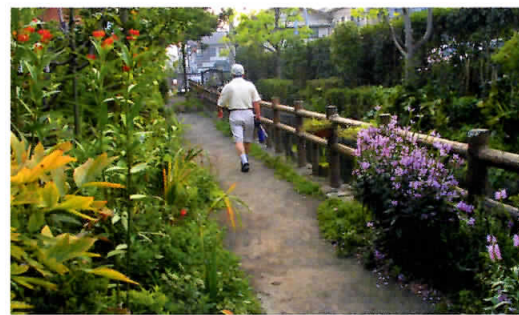
上:文蔵・根岸・辻を結ぶ『 六辻水辺公園 』。全長約2.4kmに及び、せせらぎゾーンやにぎわいゾーンなど、さまざまな楽しみ方で緑と水と空間を味わえる。「六辻」バス停徒歩3分。 下:公園を出ると、木の橋が印象的な笹目川が目の前を流れる。鴨やしらすぎなどの野鳥も。「白幡六丁目」バス停徒歩3分。