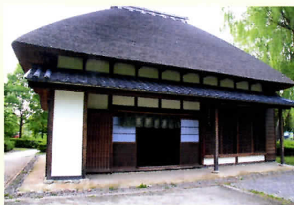
上:伝統的な建築物が移築展示されている『 浦和くらしの博物館民家園 』で、かつての暮らしに思いをはせてみては。国際興業バス「念仏橋」バス停そば。 下:竹林の中のそぞろ歩きが楽しい『 見沼通船堀公園 』。国際興業バス「附島橋」バス停徒歩1分。