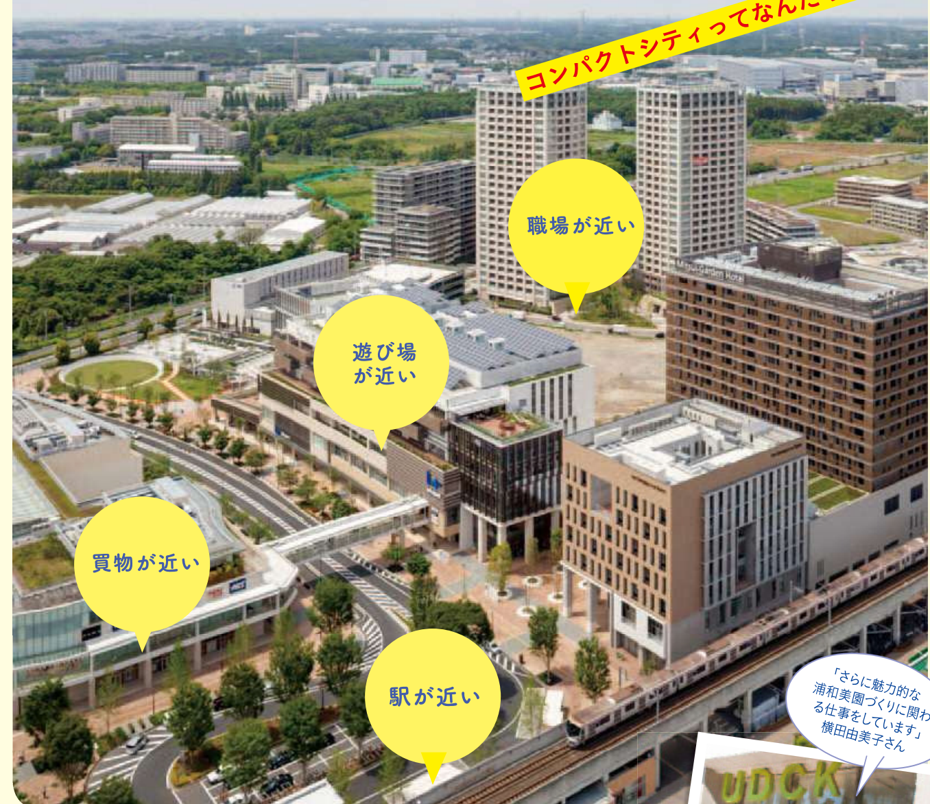
写真: 柏の葉キャンパス駅前

「コンパクトシティ」。この言葉を聞いたことがありますか? 「初めて聞いた」、「聞いたことはあるけれど、意味はよく分からない」という人もいるかもしれません。コンパクトシティとは、住宅や商業施設などのさまざまな都市機能を集め、公共交通で結んだ、便利で住みやすいまちのこと。コンパクトシティとなることで私たちの暮らすまちの未来は、どう変わっていくのでしょうか?