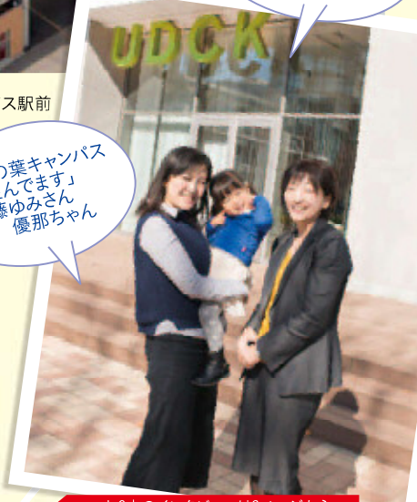
お2人のインタビューは3ページから

おまけ情報 見沼田んぼで生まれ育ったヌゥと、手賀沼在住のカシワニ。「沼つながり」の2人(?)です。カシワニはヤキトリと甘い物が大好き!そのせいで、虫歯が!?