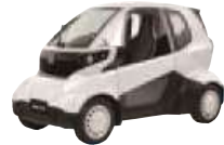
超小型パーソナルモビリティ

地域のまちづくり拠点として平成27年10月に開設された「アーバンデザインセンターみその」を核に、スマートホーム・コミュニティの形成や低炭素型モビリティの活用をはじめ、スポーツ、健康、環境・エネルギーをテーマとした副都心の形成に向けた取り組みを進めています。