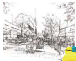
できあがりを楽しみだ~!

「柏駅周辺まちづくり10カ年計画」において、広がりを持った魅力と多様性のある市街地の形成と歩行者優先のまちづくりを推進し、通りごとに特徴を持った居心地の良い空間の検討をしています。通りに関わる方と、将来像についてワークショップを行っています。