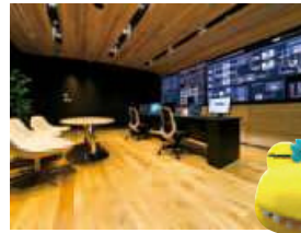
街区間で電力融通する仕組みは全国初なんだって!

「柏の葉アーバンデザインセンター」を開設し、公・民・学の連携を進める柏の葉では、街区間での電力融通やCO2排出量の見える化など「環境共生」の取り組みをはじめ、「健康未来」、「新産業創造」という3つのテーマを軸に、国際キャンパスタウンの実現に向けた取り組みを進めています。