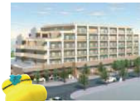
いつまでも元気で活躍できる!

高齢者が安心して元気に暮らすことができるまちづくりを進めるため、柏市、東京大学、UR都市機構3者で協力し、さまざまな医療・介護サービスを組み合わせた拠点の整備や、生きがい創出のための就労支援などを行っています。