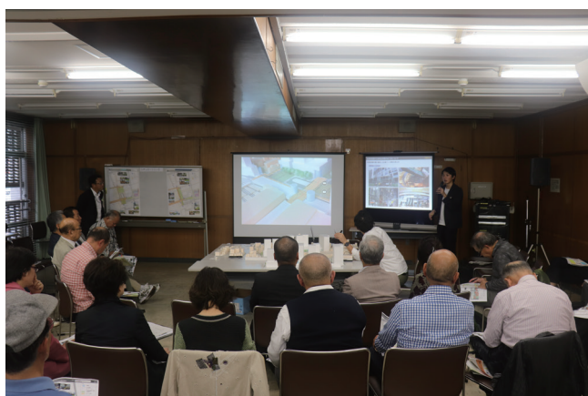
▲模型の説明の様子

オープンワーキングの詳細につきましては、後日、開催結果を市ホームページにてご報告します。