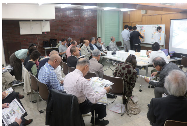
▲ラベルワークの様子