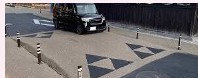
（参考事例③）イメージハンブ[岐阜県各務原市]