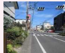
与野本町通りの現状