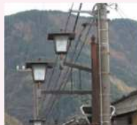
（参考事例②）電柱共架の照明灯 [富山県南砺市]