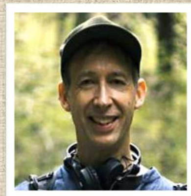
ニック ラスコム氏

1954年生。1990年、隈研吾建築都市設計事務所設立。慶應義塾大学教授、東京大学教授を経て、現在、東京大学特別教授・名誉教授。30を超える国々でプロジェクトが進行中。自然と技術と人間の新しい関係を切り開く建築を提案。