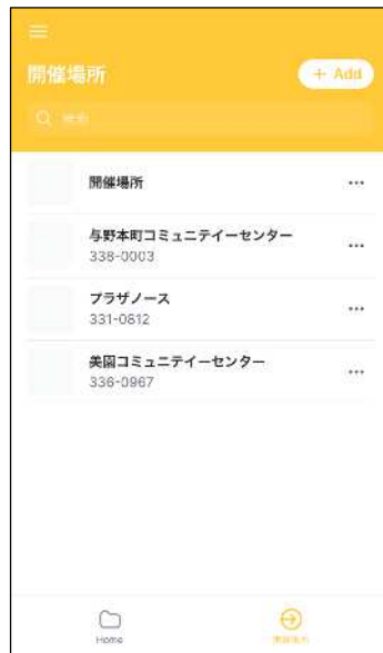
・ワークショップの開催場所について一覧を見ることができ、施設 の詳細も確認することができます。