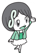
さいたま市消費生活総合センター マスコットキャラクター さいたましょうこちゃん

〒330-0853 さいたま市大宮区錦町682-2 JACK大宮6階 TEL.048-643-2239 FAX.048-643-2247