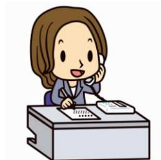
さいたま市消費生活総合センター マスコットキャラクター 相談員さん