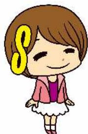
さいたま市消費生活総合センター マスコットキャラクター さいたま しょうこちゃん