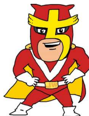
さいたま市消費生活総合センター マスコットキャラクター チョットマッタマン