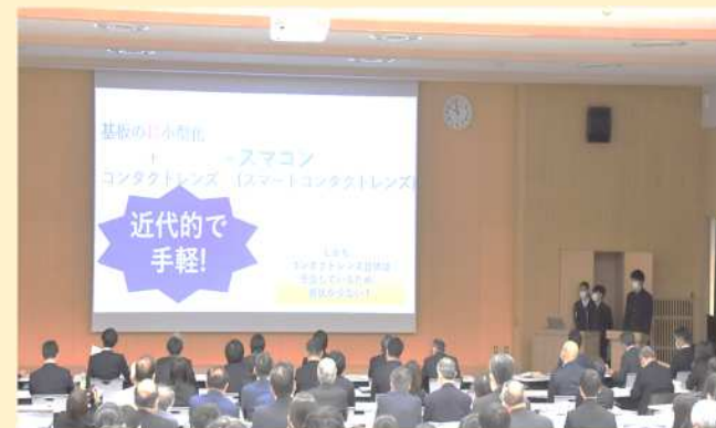
※昨年度の「さいたまカップ」の様子

参加者 ・探究学習プログラム「さいたまエンジン」実施校7校の代表生徒36チーム（予定） ・「さいたまエンジン」参画企業13社