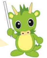
さいたま市PRキャラクター つなが竜ヌゥ

これまで学校で行っていた学校給食費の管理を市が行うことで、 会計の透明化 を図るものになります。