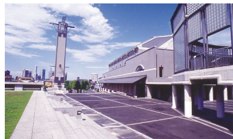
彩の国さいたま芸術劇場