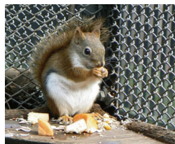
大宮公園(小動物園)