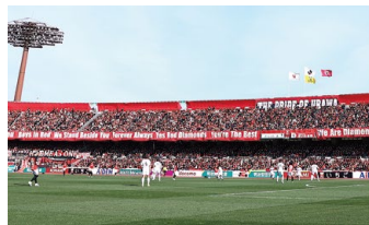
浦和駒場スタジアム