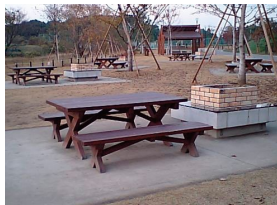
秋葉の森総合公園(ピクニック広場)