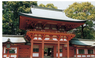
武蔵一宮氷川神社