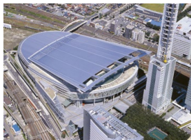
さいたまスーパーアリーナ