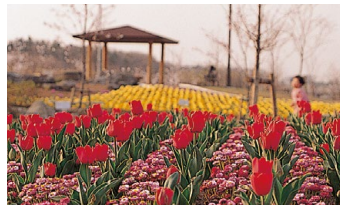
大宮花の丘農林公苑