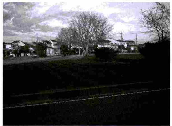
▲真福寺貝塚 台地から谷に向かう斜面

縄文時代の後半には、海は次第に内陸から遠ざかり、海が引いた後には河川や湿地が発達していきます。「真福寺貝塚」（岩槻区城南、国）や「馬場小室山遺跡」（緑区三室）は、この時期を代表する遺跡です。「真福寺貝塚」は、綾瀬川低地から台地内へと伸びる谷の先端（谷頭）が迫った台地上に広がり、「馬場小室山遺跡」は芝川低地に面した台地縁辺に広がっており、どちらも低地の利用を強く意識していると考えられます。この内、「真福寺貝塚」では、遺跡の中には貝塚も形成されていて、恐らく谷を綾瀬川低地へと下り、貝を採取していたのでしょう。真福寺貝塚で出土する貝は海水と淡水が交じり合ったあたりに生息する貝（ヤマトシジミ）が中心です。この時期まで、綾瀬川低地の付近にはまだ海が残っていたことがうかがわれます。