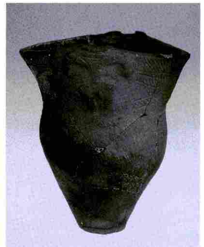
▲馬場小室山遺跡出土 土偶装飾土器

「馬場小室山遺跡」の出土遺物は、「馬場小室山遺跡出土 土偶装飾土器・人面画土器」（県）や「馬場小室山遺跡第51号土壙出土縄文土器」（県）が文化財に指定されています。他に、「大谷場遺跡出土晩期縄文式土器」（南区南本町、大谷場遺跡出土）や「亀形土製品及び伴出遺物」（見沼区東大宮、東北原遺跡出土、県）などがこの時期の指定文化財です。