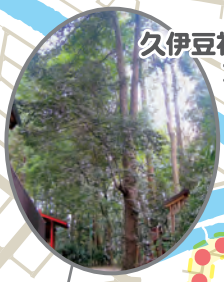
久伊豆神社の大サカキ