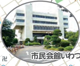
市民会館いわつき