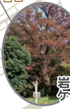
岩槻城跡のケヤキ