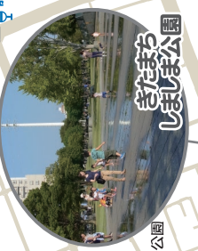
ぎだまちしましま公園