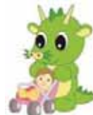
さいたま市 PRキャラクター 「つなが竜」