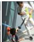
バルーンアート講座