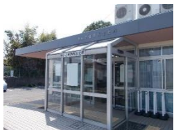
支所・市民の窓口