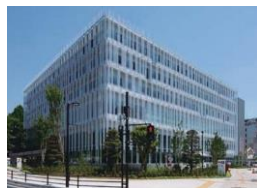
区役所・市税事務所