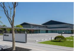
岩槻人形博物館 IWATSUKI NINGYO MUSEUM