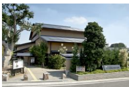
さいたま市 大宮盆栽美術館