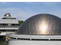
さいたま市青少年宇宙科学館