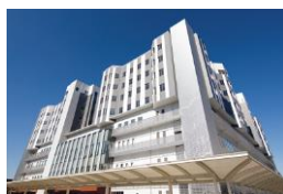
さいたま市立病院