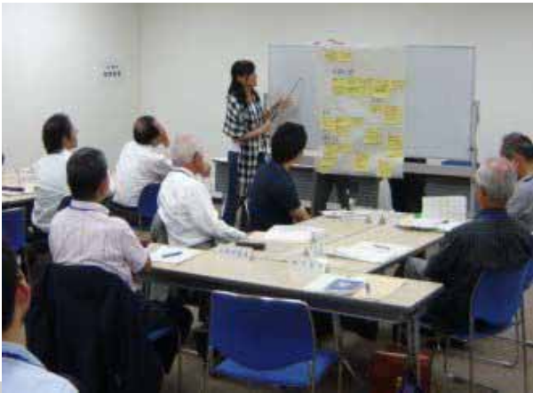
検討委員会の風景

さいたま市では、平成 23 年度末までの制定を目指し、「さいたま市自治基本条例検討委員会」において、「(仮称)さいたま市自治基本条例」の検討を行っています。委員会では、検討にあたり、市民のみなさん、議会、行政などと意見交換していきたいと考えています。