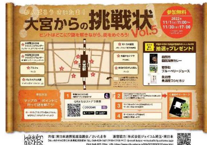
▲チラシ（市内小学校・幼稚園等に配布）