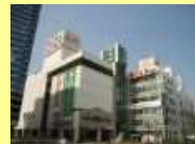
丸井・ハンズ・ダイエー