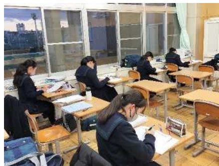
浦和中学校 令和5年11月28日(火) 定期テストに向けた自主学習