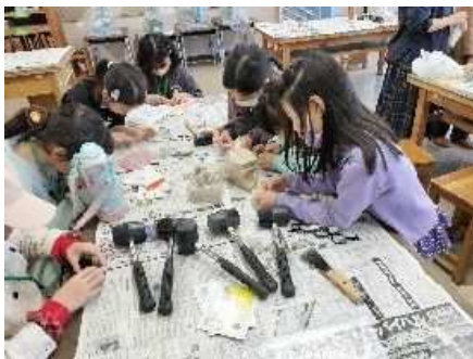
指扇北小学校 令和5年12月9日(土) 大宮国際中等教育学校の教員による化石発掘体験