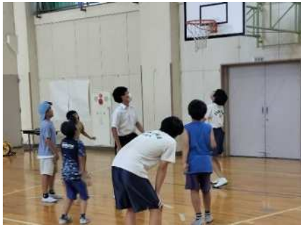
常盤北小学校 令和5年9月14日(木) 体育館で中学生とバスケットボールの試合