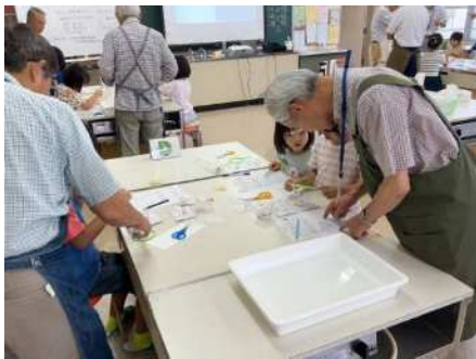
大宮北小学校 令和5年9月9日(土) 外部講師による理科実験の講座