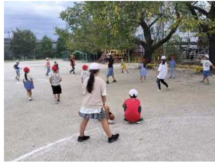
太田小学校 令和5年10月2日(月) 校庭でドッジボール