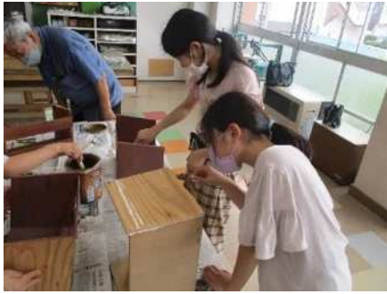
植竹小学校 令和5年6月26日(月) 地元工務店の方による本立ての製作教室