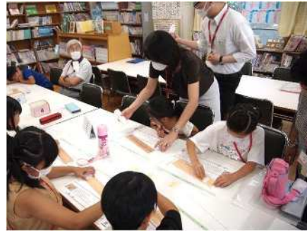
大宮西小学校 令和5年7月10日(月) リコージャパン株式会社によるSDGsの出前講座