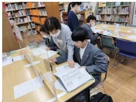
田島中学校 令和6年2月20日(火) 学習アドバイザーによる個別学習指導