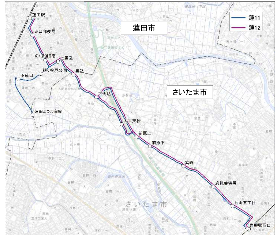
※電子地形図(国土地理院)を加工して作成