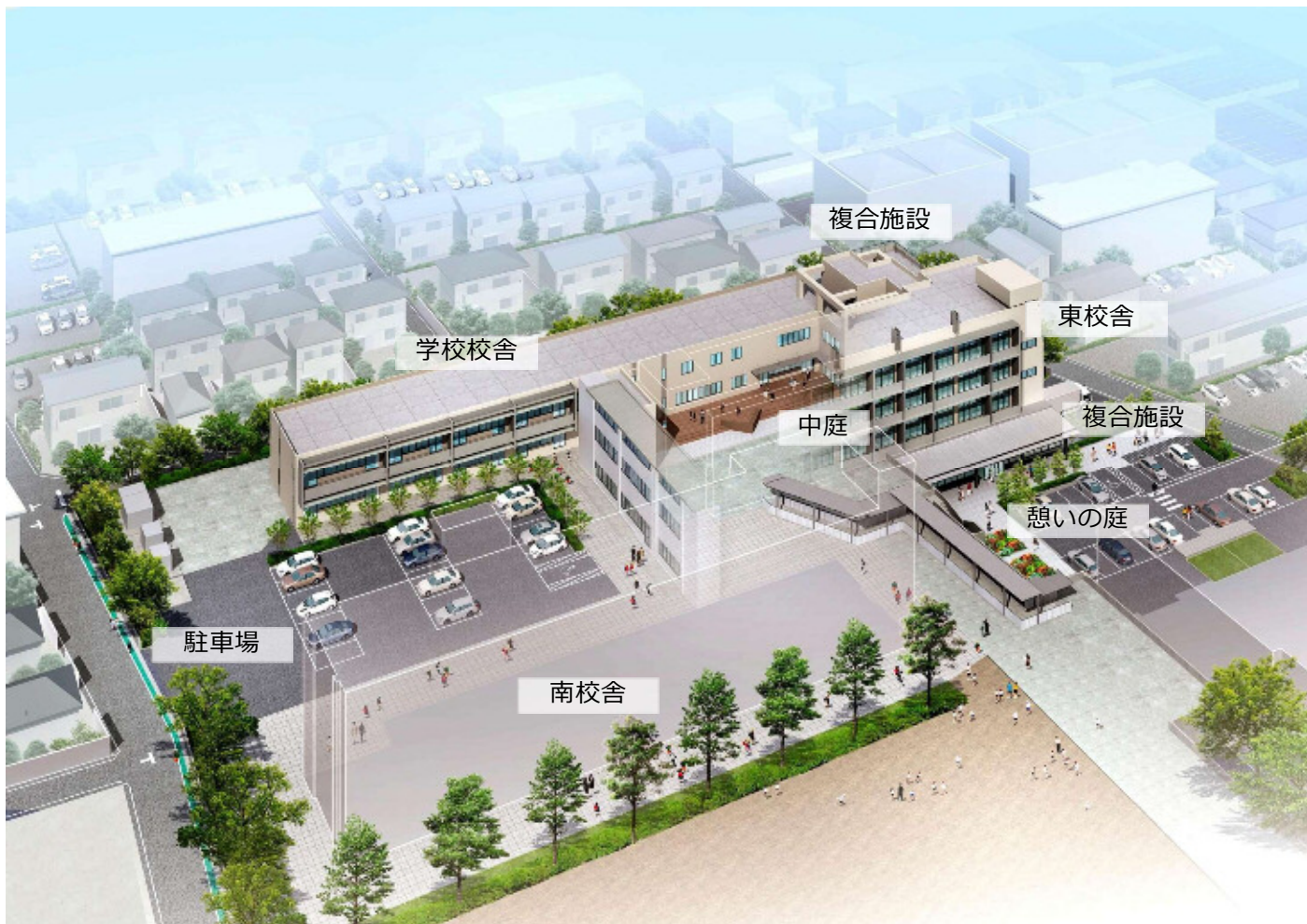
与野本町小学校複合施設 鳥瞰イメージ図