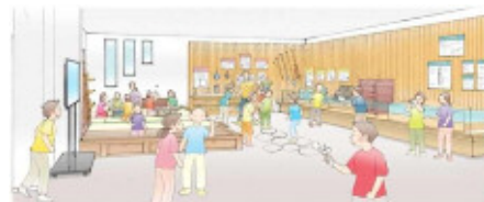
与野郷土資料館の内外イメージ