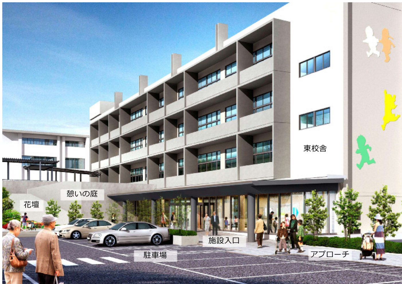
与野本町小学校複合施設 外観イメージ図