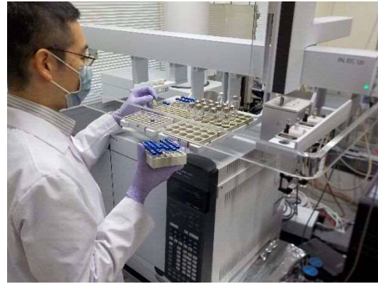
理化学検査の様子