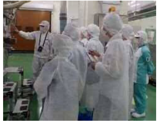
一日食品衛生監視員 工場内監視の様子

低年齢層を含めた消費者が食品衛生監視業務を体験できるイベント（10組20名程度）を実施し食の安全に関する知識の普及を図ります。