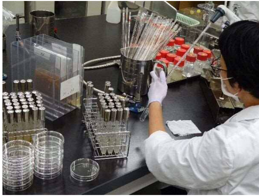
微生物検査の様子