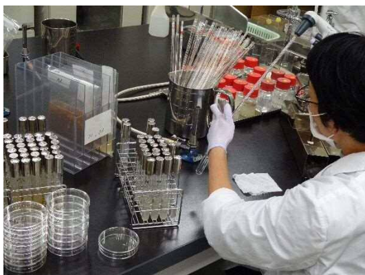
微生物検査の様子