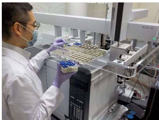
理化学検査の様子