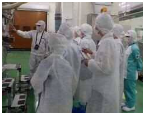
一日食品衛生監視員 工場内監視の様子

低年齢層を含めた消費者が食品衛生監視業務を体験できるイベント（10組20名程度）を実施し食の安全に関する知識の普及を図ります。