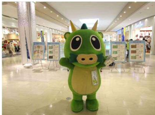
街頭キャンペーンの様子

ノロウイルスによる食中毒や感染症に対する正しい知識の習得と調理従事者による二次感染を未然に防止することを目的に、市内の福祉施設や学校等にノロウイルスに関するリーフレットの配布や研修会を開催するとともに、消費者への街頭キャンペーンを実施し、知識の普及啓発を図ります。