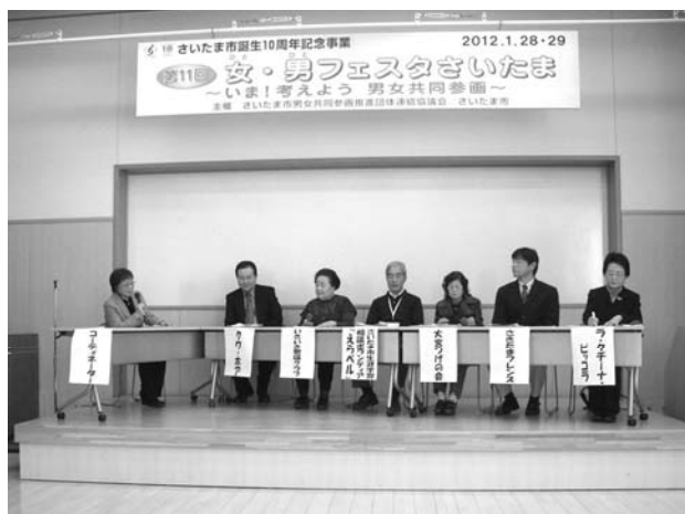
▲参加団体代表者によるトーク&トーク

期日 平成24年1月28日(土)・29日(日) 会場 シーノ大宮センタープラザ 9階・10階