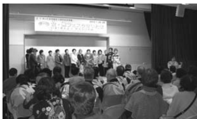
▲女・男フェスタさいたまでのファッションショー

日本伝統の着物。現代人には忘れ去られ、筆筒の奥深くに眠らせておくのはもったいない。そこで「着物から洋服に」。着物は絹色彩も最高です。その後、公民館や文化教室で大勢の皆様にも理解を深めたく、「女・男フェスタさいたま」にも参画しました。自分で製作した洋服で、生徒たちがモデルになりファッションショー。NHKの「地球大好き」という環境番組に取り上げられ、NHKホールで発表しました。 平成12年に創設した大宮混声合唱団と共に、昨年6月、市民会館おみや大ホールで発表。「変身 甦る世界」ファッションショーと、「音と彩のファンタジー」を展開。当日のドレスは着物と帯からのリフォームでした。 ご参加くださった皆様より温かいご寄付をいただき、読売新聞社を通して、東日本大震災被災者に寄付させていただきました。 洋彩の会 代表(若生子)