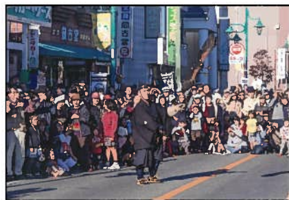
「注目の一瞬」 (昨年度最優秀作品)

11月3日(木・祝)に岩槻駅東口で行われる「第4回城下町岩槻鷹狩り行列」を題材としたフォトコンテストです。