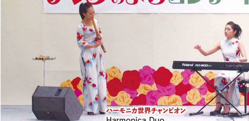
ハーモニカ世界チャンピオン Harmonica Duo