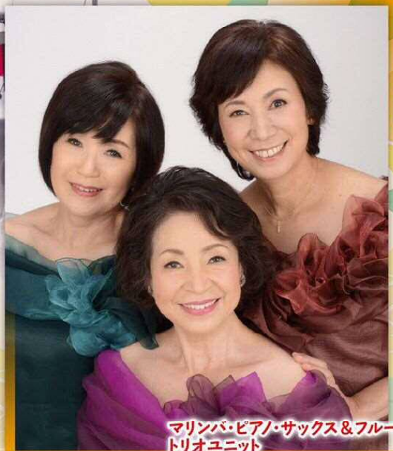
マリンバ・ピアノ・サクソ&フルート トリオユニット