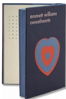
エメット・ウィリアムス 《スウィートハート》 サムシング・エルス・プレス刊、1967年