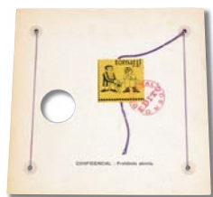
エドガルド・アントニオ・ヴィゴ 《機密情報・開封禁止》 発行者・刊行年不明