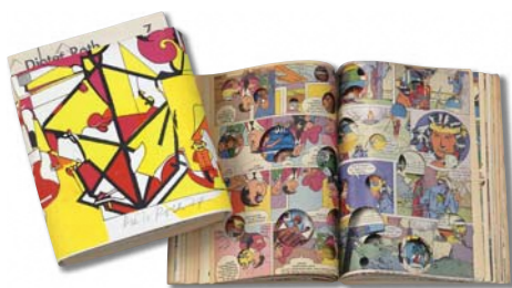
ディーター・ロート 《作品集 第7巻「Bok3bとBok3d」》 ハンスヨルク・マイヤー刊、1974年 ©Dieter Roth Estate Courtesy Hauser & Wirth