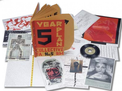
リマ・ゲルロヴィナ、ヴァレリイ・ゲルロヴィン 他 《コレクティブ・ファーム1-6号》 コレクティブ・ファーム刊、1981-87年