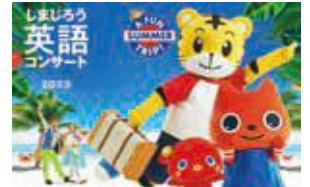
しまじろう

会館特別価格3,480円※特典シール付き(シールは 公演当日、RaiBoC Hall 4階窓口にてお渡しします)(全 席指定) 3歳以上有料。3歳未満は保護者1名につき おささま1名まで路上無料(席が必要な場合は有料)。