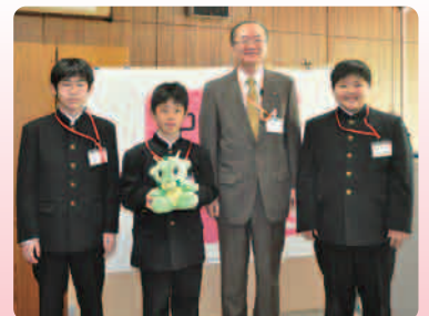
▲1月28日(水) 未来くるワーク体験の中学生と

童・生徒が晴れの卒業式を迎えます。新たなスタートをお祝いするとともに、今後の末長いご活躍を期待しております。