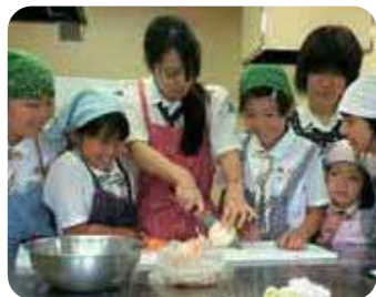
▲野外料理の練習 カレー作り