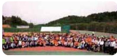
▲斑尾高原ふるさとカップ 第1回グラウンド・ゴルフ大会