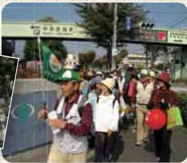
◀3コースの「ふるさと散歩マップ」をご用意しています。事務局までどうぞ。