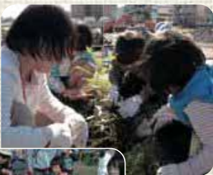
▶早く大きくなあれ!