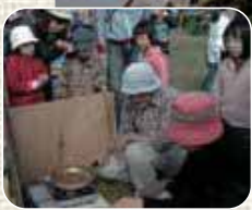
◀ドングリってどんな味?