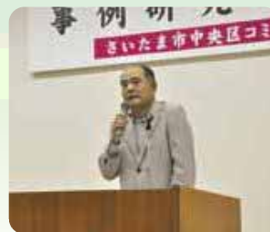
▲与野・水と緑の会