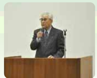
▲(公益社団法人)さいたま市シルバー 人材センター与野地区親睦会