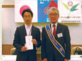
▲2013~14年度 米山記念奨学金授与の様子