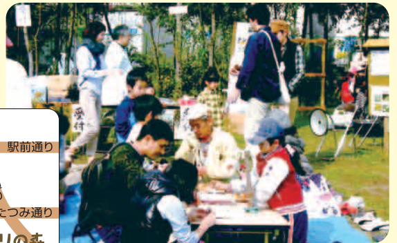
※写真は昨年度の事業の様子です。