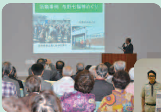
※写真は昨年度の事例研究のつどい の様子です。