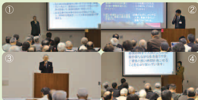
▼4 団体による発表の様子