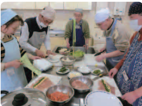
▲シルバーシェフクッキングスクールの様子

「自分の地域は自分たちで良くして行こう」を合言葉に誰もが安心して暮らすことのできる福祉のまちづくりを目指して、自治会や民生委員児童委員、各団体、ボランティアグループで組織された住民主体の協議会です。