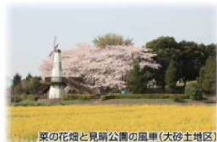
菜の花畑と見沼公園の風車(大砂土地区)

さいたま市10周年を記念して区の緑化推進のシンボルフラワーとなる「区の花」を制定しました。 市民の森（見沼グリーンセンター）南側の、菜の花畑と風車の風景は、北区の風物詩となっています。