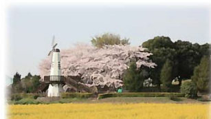
菜の花畑と見沼公園の風車(大砂土地区)

市民の森（見沼グリーンセンター）南側の、菜の花畑と風車の風景は、北区の風物詩となっています。