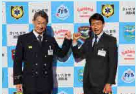
北消防署とともに、安心安全なまちづくりに取り組みます

さらには、北消防署は北区民まつりにもミニ消防フェアを出展しました。これからも様々な機会を捉え北消防署と協力し、地域の皆さんとともに安心安全なまちづくりに取り組んでまいります。