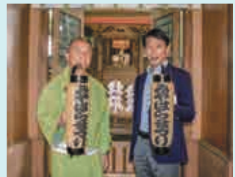
みやはらまつり実行委員会の畔川委員長とともに