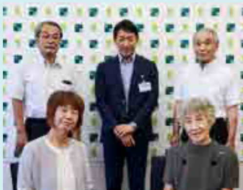
北区民生委員・児童委員協議会正副会長さんとともに

北区では、約140人の民生委員・児童委員が日々活動に励んでいます。そのご尽力と奉仕の精神に改めて敬意を表するとともに、感謝を申し上げます。