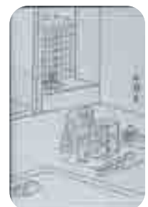
「亦復一楽茶会図録」から

期日 2月10日(土)～3月20日(祝) 会場 大宮盆栽美術館 企画展示室 ほか