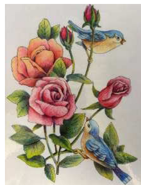
過去の受講者作品より

大古里公民館の視聴覚室では、「Saitama City Free Wi-Fi」のご利用ができます。