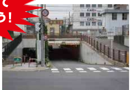
交通量が多いため通行注意! 自転車の飛び出しも多い!