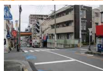
通りに出る際、左右からの車等が見にくいいため 注意する交差点。