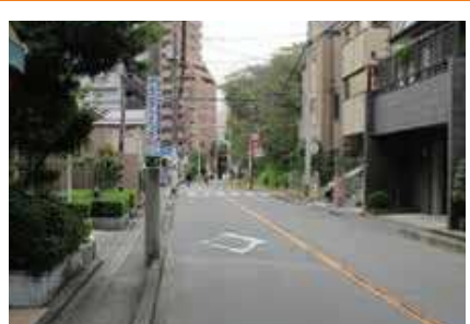
信号の無い交差点が多いため横断注意! 自転車の飛び出しも多い!