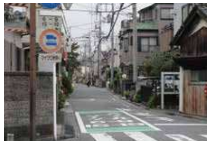
交通量が多く道路幅が狭いため通行注意!