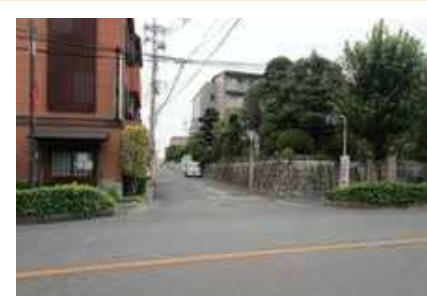
自転車の飛び出しが多い。通行注意!