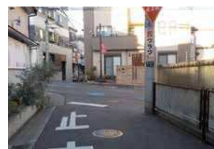
丁字路で、大通りから入る自転車の飛び出しが多い。 通行注意!