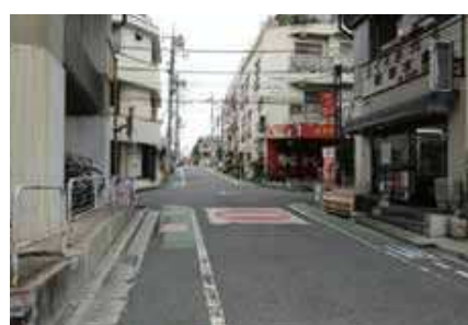
駅に向かう自転車の飛び出しが多い交差点。 通行注意!