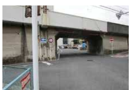
高架下の見通しが悪いため通行注意! 自転車の飛び出しも多い!