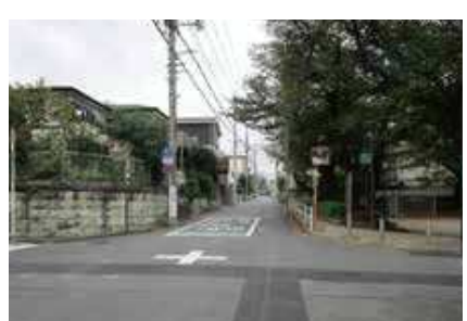
交通量が多く道路幅が狭いため通行注意!