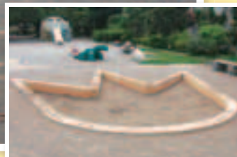
恐竜の足跡の形をした砂場