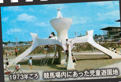
1973年ごろ 競馬場内にあった児童遊園地