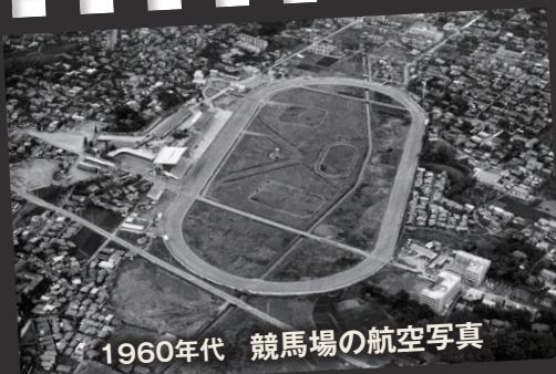
1960年代 競馬場の航空写真

「南区ふるさとふれあいフェア」の会場となっている浦和競馬場は、古くから区民の憩いの場としても親しまれてきました。