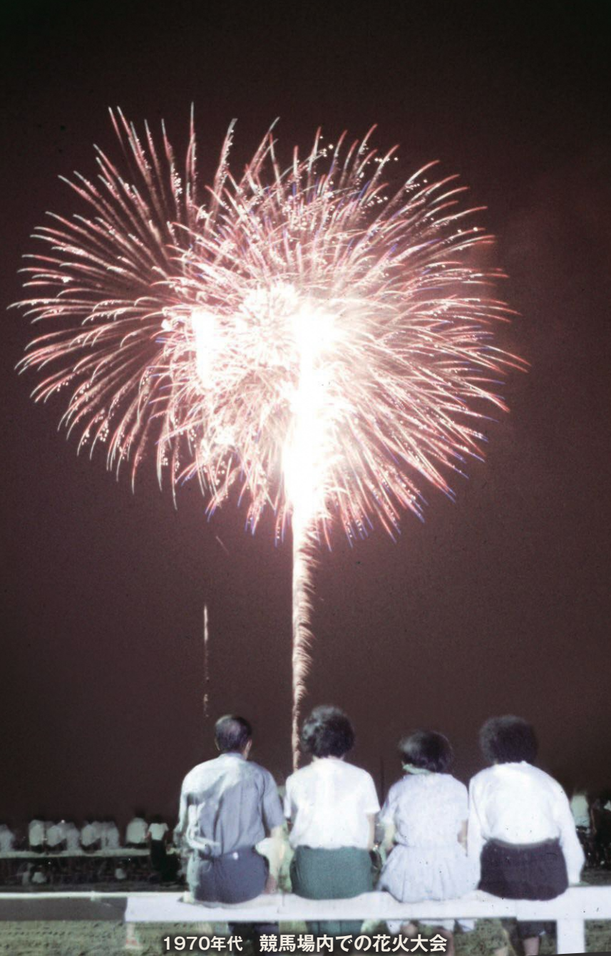
1970年代 競馬場内での花火大会