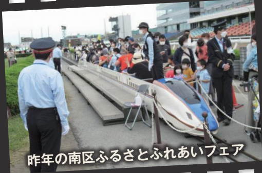
昨年の南区ふるさとふれあいフェア