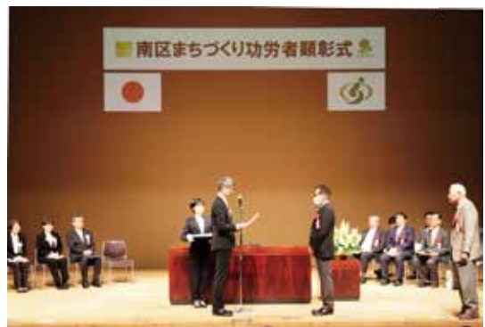
南区まちづくり功労者顕彰式

長く地域の発展を支えてこられた自治会役員の方々の功績を讃えるため、顕彰式典を開催し、感謝状を贈呈します。