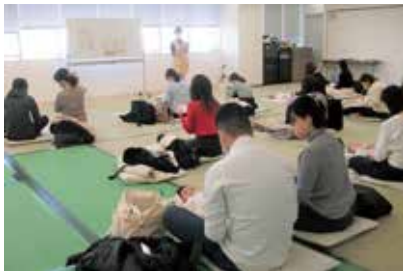
みなみっこクラブ

育児中の保護者が、できるだけ早い時期（生後2・3か月）に必要な知識を習得し、地域での仲間づくりができるよう、全乳児とその保護者を対象に育児学級を開催します。