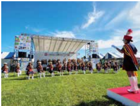
ふれあいステージ