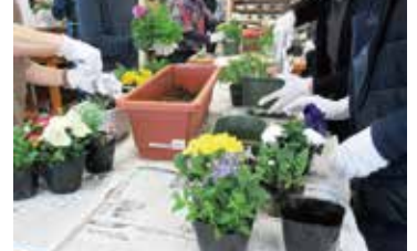
ガーデニング教室

民有地の緑化に積極的に取り組み、緑を増やすため、季節の花等を題材に、プランターを活用したガーデニング教室を開催します。