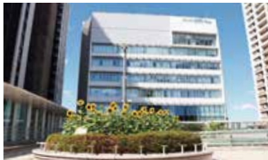
武蔵浦和駅西口円形花壇

区の花「ヒマワリ」を通じて、区への愛着をはぐくむため、サウスピア周辺や別所沼公園にヒマワリを植栽し、区内保育園や小・中学校などへ花苗の提供をします。