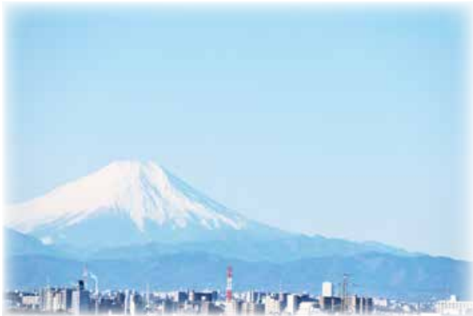
冬：サウスピア屋上