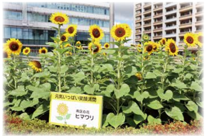
夏：武蔵浦和駅西口円形花壇