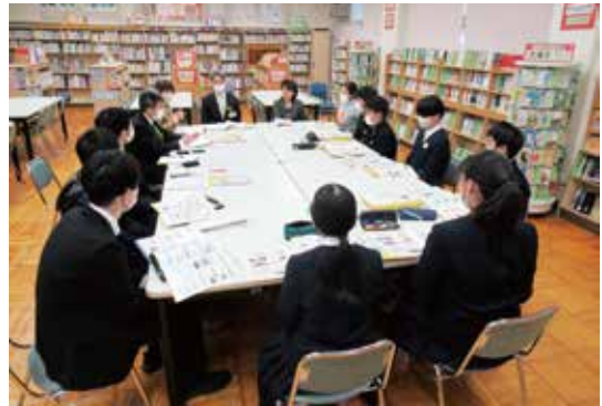
ヒマワリミーティング

区の特徴あるまちづくりを進めるため、次世代を担う中学生等の意見やアイデアを聴取する機会として「ヒマワリミーティング」を開催します。