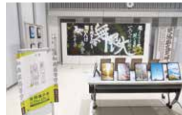
コラボレーションイベント

サウスピアなどを活用し、区内中学校・高等学校生徒の活動の発表の場となるイベントを実施し、区民と学校をつなぐPRをします。