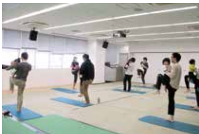
Be 筋肉～パパと子どものエクササイズ

また、健康に関する啓発用ポスターの駅等への掲出やSNSでの情報発信により、若い世代からの健康づくりを推進します。