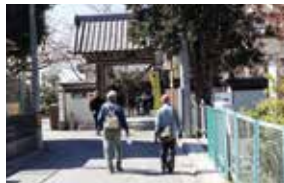
ウォーキングイベント

歴史ある地域資源など、区の魅力を発見するとともに、参加者間の交流や健康づくりを進めるため、ウォーキングイベントを開催します。