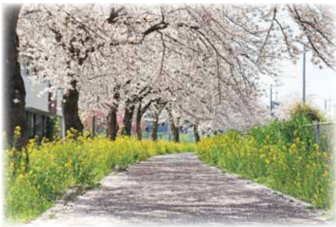
春：フラワーロード