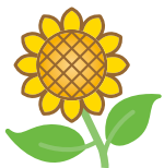
南区の花 ヒマワリ

区の色であるレモン色にちなんで選ばれたヒマワリは、区の色と同様に花の特徴が南区の若々しいイメージにあっている花です。