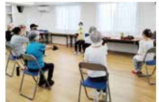
ますます元気教室

また、「すこやか運動教室」等に地域運動支援員※を派遣し、体操を活用した介護予防を進めます。