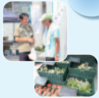
▲みぬマルシェにて