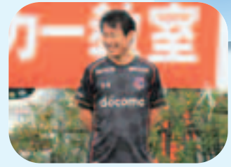
▲見沼区少年少女サッカー教室にて

今年も様々な機会を通して区民の皆さんには多くのご支援・ご協力をいただきましたことに、心より感謝するとともに健康でよい年を迎えられますよう祈念申し上げます。