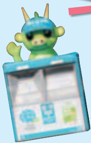
▲ラッピングポスト