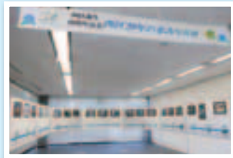
▲西区20年の歩み写真展