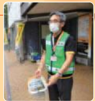
ツー・ロック運動の様子