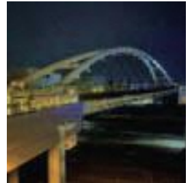
大宮ほこすぎ橋 (吉敷町)

「大宮ほこすぎ橋」は、氷川参道一の鳥居そばから、中山道とJR線に架かる歩行者と自転車の専用道路です。そのため、静かに夜景を堪能することができます。見上げる夜空には月と星と旅客機が光を放ち、見下ろすとコンテナ輸送貨物列車が闇を