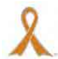
子ども虐待防止 オレンジリボン運動

連絡先 児童相談所虐待対応ダイヤル ☎189 桜区支援課 ☎856・6171 ☎856・6276 浦和西警察署 ☎854・0110(代表)